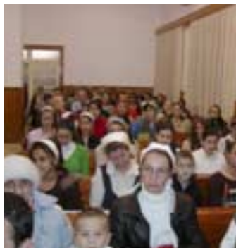
Biserica creștină după Evanghelia Ploieștiori, predica duminică seara

Ultimul seminar din această serie s-a desfășurat la Ploiești (6.11-9.11.2008), pe tema „ Pe drum în zilele din urmă “.