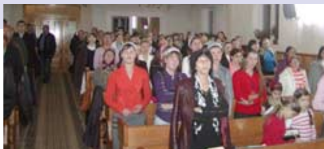
Biserica creștină Betel din Suceava, unde a avut loc seminarul „Pe drum în zilele din urmă“

Va fi ca pe timpul lui Noe! La Dumnezeu nostru există un „prea târziu“. Există o zi în care Dumnezeu spune că acum s-a sfârșit timpul harului.