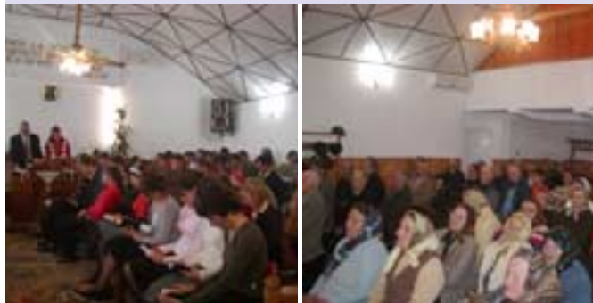
Biserica creștină după Evanghelie din Prelișca, predica de duminică dimineața