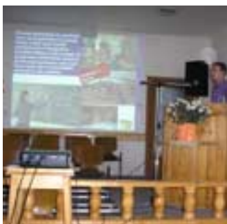
Prezentarea lucrării ethos open hands din Craiova