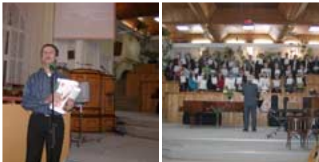
Biserica creștină după Evanghelia nr.1, Iași, predica de duminică seara