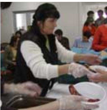
Biserica Agape, masa de prânz de sămbătă, specialitate elvețiană