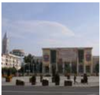
Centrul orașului Bacău