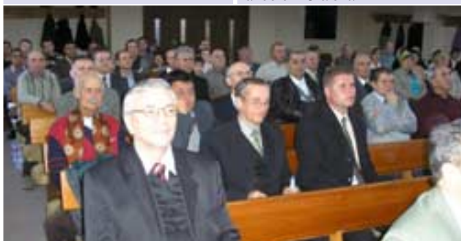
Biserica creștină Filadelfia din Bacău, seminar „Educația copiilor”

În Bacău (16.10-19.10.2008), subiectul prelegerii a fost „ Educația copiilor – investiție pentru viitor “.