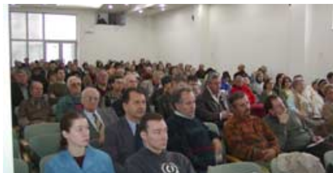
Biserica creștină Agape, Ploiești, seminar „Pe drum în zilele din urmă“